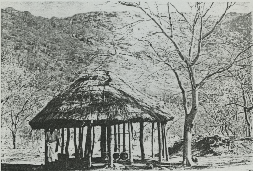
32 — Estima. No dzimbabué do Mphondolo Inyampando . O homem é o respectivo Kábandázi , e guardião do lugar.