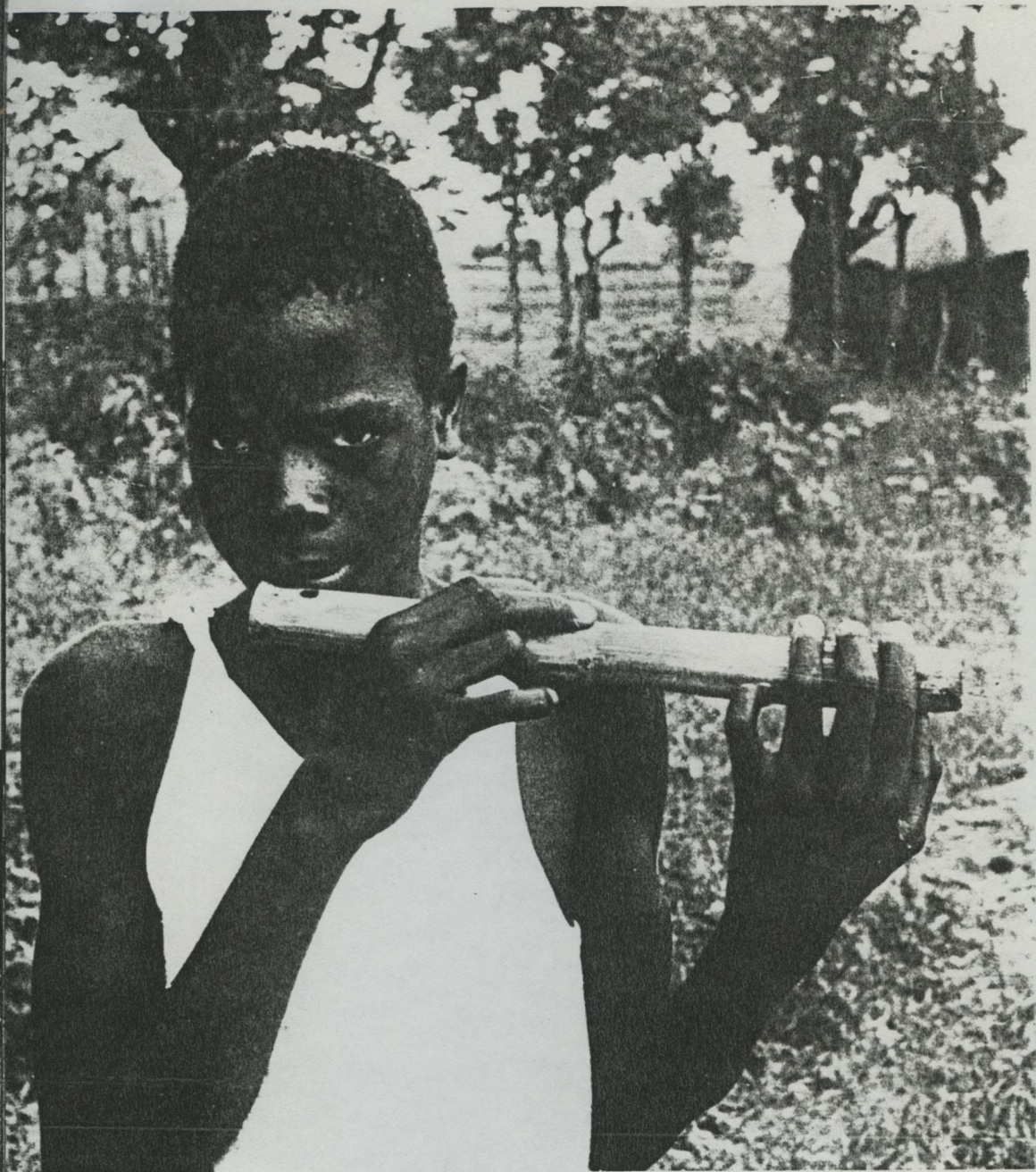
30 — Chiricahua. Tocador de flauta.