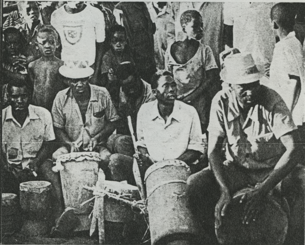
28 — Estima. Tocadores de tambores, na dança do «Espírito de macaco».