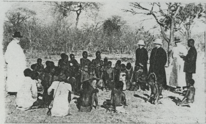
Missão da Mupa. Escola de Kalembe. — Exame de catecúmenos.

in Portugal em África, Revista de Cultura Missionária