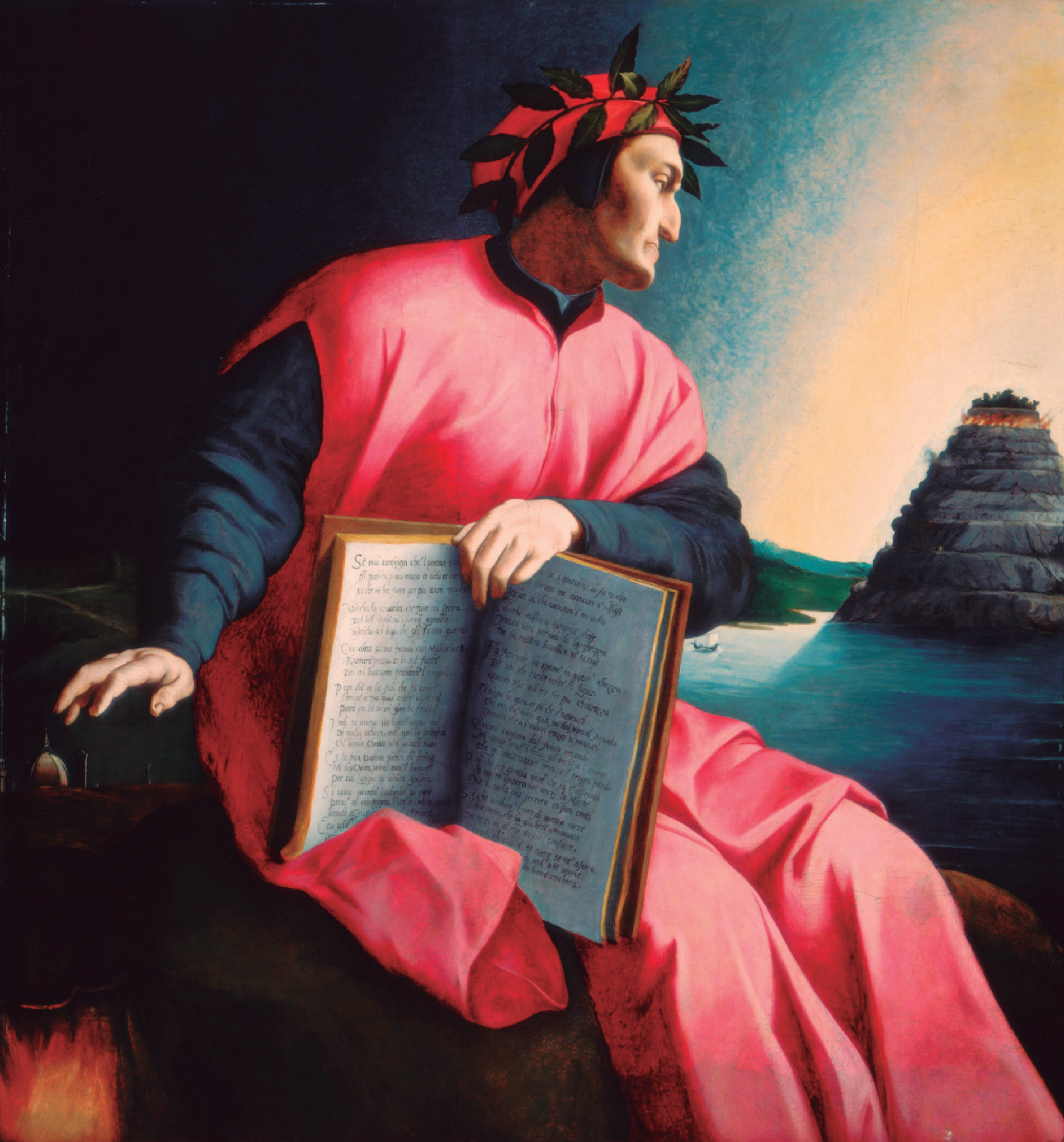
Agnolo Bronzino, Retrato de Dante Alighieri (1530). National Art Gallery, Washington